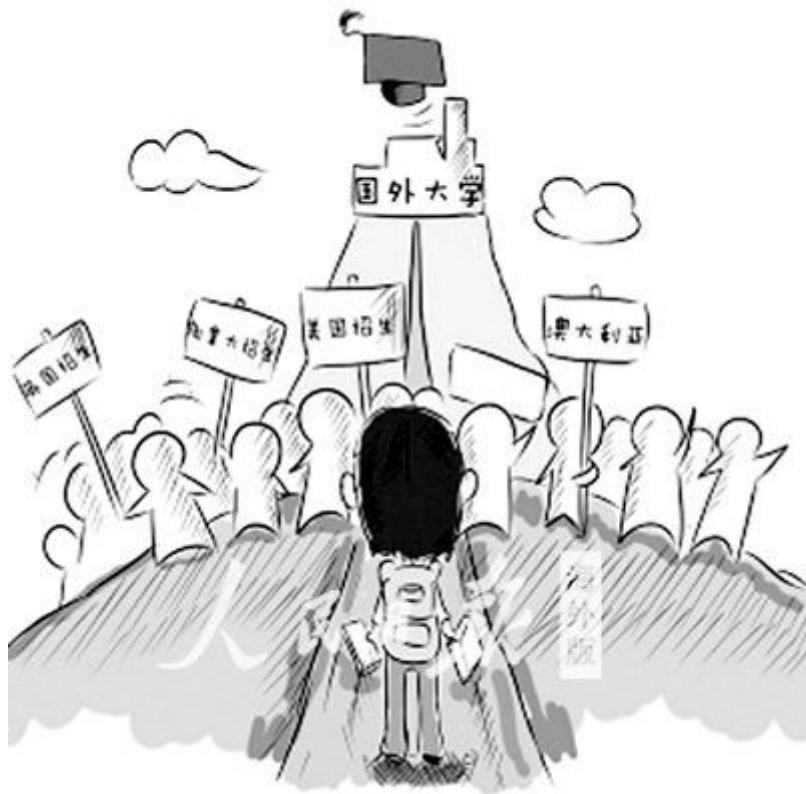
陈骁绘 《人民日报海外版》（2012年12月21日 第06版）