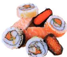
寿司 shòusī sushi