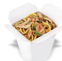
面条 miàntiáo noodles