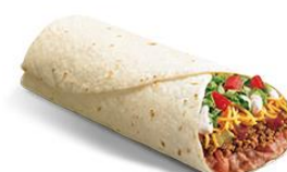
墨西哥卷饼 mòxīgē juǎnbǐng burrito