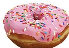
甜甜圈 tiántiánquān doughnut