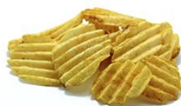
薯片 shǔpiàn chips