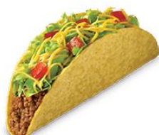
玉米卷 yùmǐ juǎn taco