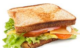
三明治 sānmíngzhì sandwich