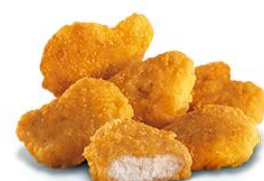
鸡块 jī kuài chicken nuggets