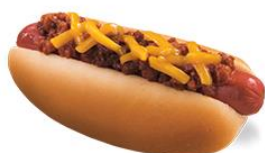
热狗 règǒu hot dog