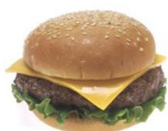
汉堡包 hànbǎobāo hamburger