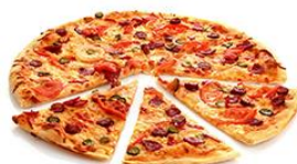
披萨 pīsà pizza